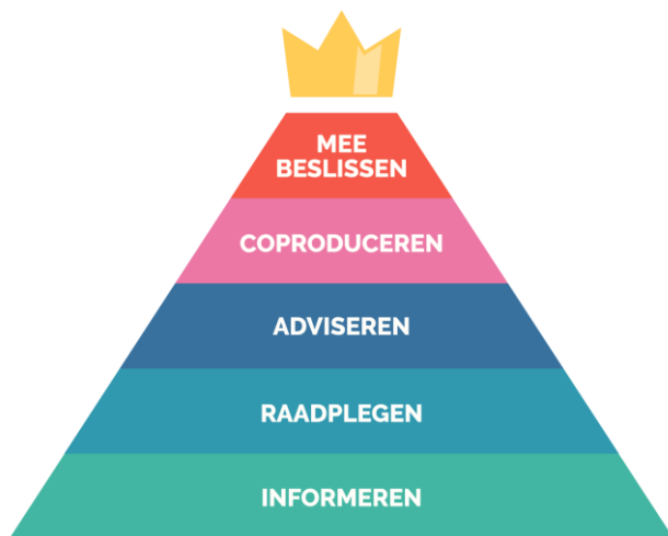
Figuur 1. De participatieladder

De participatieladder onderscheidt de volgende niveaus: